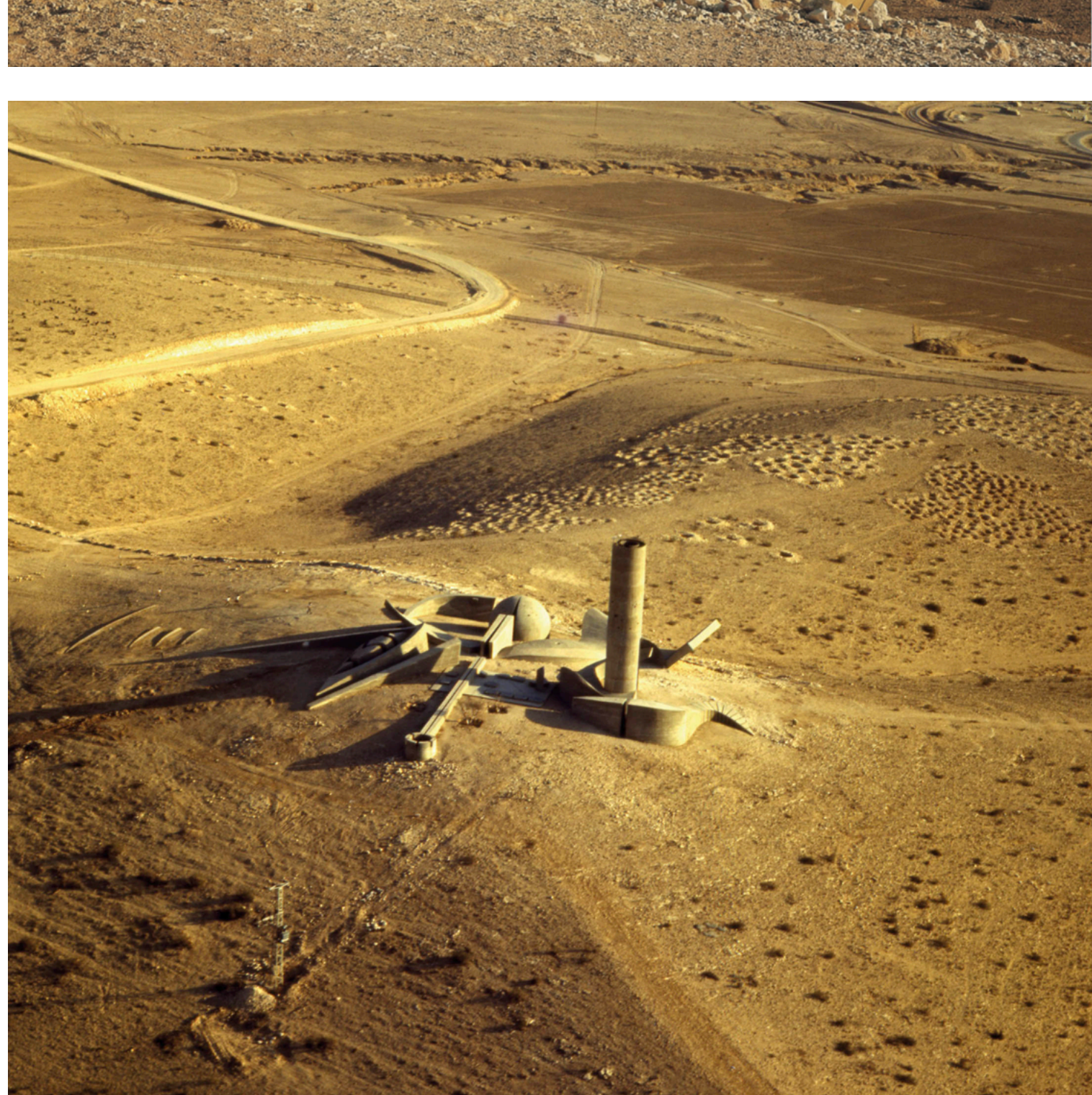
Neguev Monument, 1963-1968, Israël