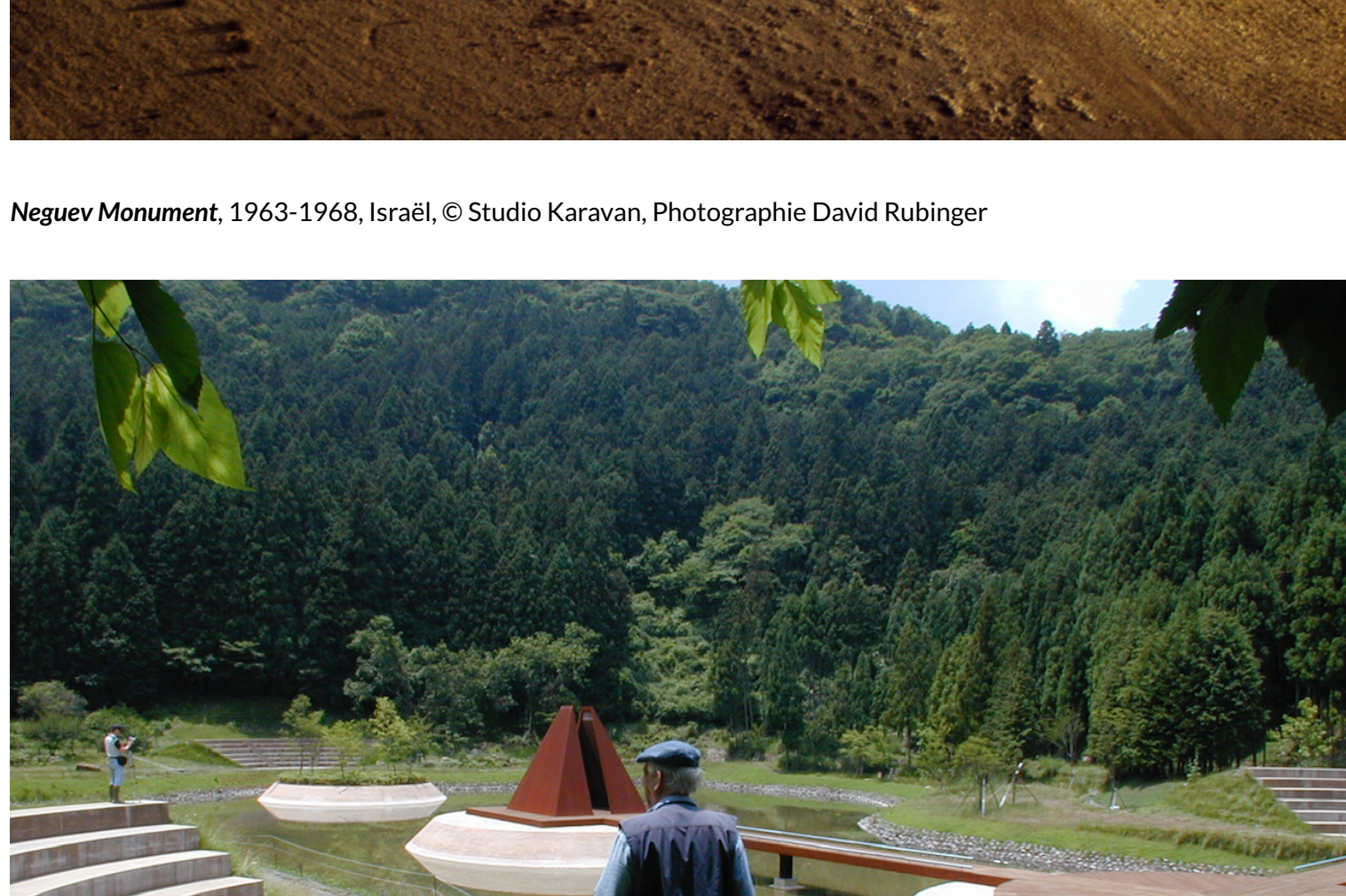
Dani Karavan contemplant la sculpture environnementale de Murou au Japon