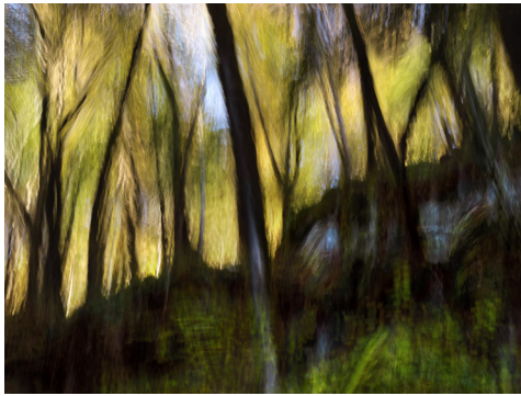
Les Arbres du Puy Noir - Ornans, 2019 Tirage pigmentaire sur papier Fine Art, Edition de 3 et de 2 EA, 90 x 120 cm

Dans le cadre du mois de la photographie 2021, la galerie a invité l'artiste Georges Poncet à présenter ses récentes séries photographiques, intitulée Spiritus , respiration de l'âme.