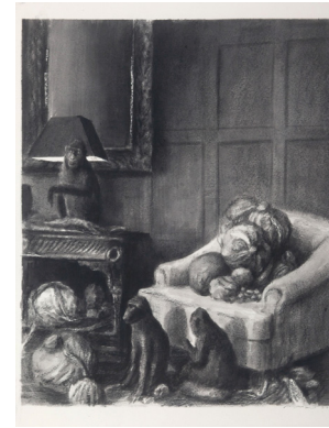
Untitled, 2020 Graphite, fusain et monochrome acrylique, gesso sur papier coton, 38 x 30 cm

Soutenu par la galerie depuis 2010, Miguel Branco, l'un des artistes majeurs de la scène artistique portugaise contemporaine, sera mis à l'honneur par Festival de l'Histoire de l'Art au Château de Fontainebleau à partir du 3 juin jusqu'au 18 septembre 2022 , dans le cadre de la Saison France-Portugal 2022 . Dans ses peintures, dessins et sculptures, l'artiste revisite souvent des images puisées dans l'histoire de l'art, questionnant la nature et l'homme, son évolution, à travers l'animal et son regard.