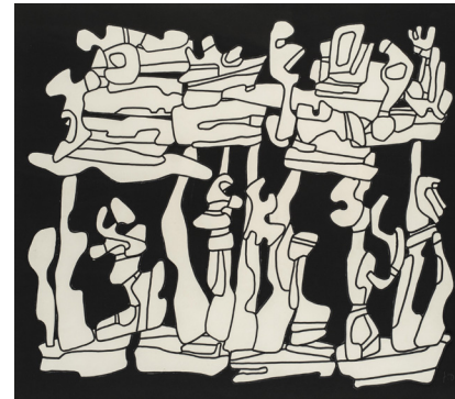
Arbres portant un château de réminiscences, 30 décembre 1970 Marker P 149 (noir) sur papier (découpé et collé sur papier noir), 50 x 57 cm, encadrée 68 x 75 cm

Les premiers contacts de Jean Dubuffet avec la galerie Jeanne Bucher datent de 1931, il y a 90 ans.