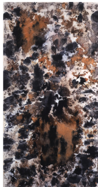
Sans titre , 1961 Monotype sur papier, 99 x 50 cm, encadrée 120,3 x 69,8 cm

À l'occasion des 130 ans de la naissance de Mark Tobey (1890 – 1976), la galerie, en collaboration avec le Centre Pompidou et la Collection de Bueil & Ract-Madoux, a rendu hommage à l'artiste en lui consacrant une importante exposition monographique, présentant une quarantaine d'œuvres essentielles. La première exposition importante en France depuis celle qui lui fut dédiée en 1961 – il y a près de 60 ans – au Musée des Arts décoratifs. A l'occasion de cette exposition, un catalogue a été publié chez Gallimard.