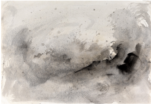
Untitled, 2006. Encre sur papier, 35,3 x 50,5 cm

La galerie soutient l'artiste suisse-américain, portugais d'adoption, depuis 2006, et lui a consacré une nouvelle exposition personnelle en 2020, après l'inauguration du Ciel de l'Eglise Santa Isabel de Lisbonne en 2016 et l'importante rétrospective dédiée à Michael Biberstein par Culturgest Lisbonne en 2018.