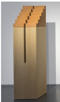
Teomim - Jumelles, 2014 Béton de terre et bois, 148,5 x 36 x 36 cm

Dani Karavan est connu pour ses interventions exceptionnelles dans le paysage, à la fois monumentales et minimales. Ses archi-sculptures environnementales portant une parole d'union et de paix sont installées dans le monde entier. Son œuvre profondément humaniste puise sa matière d'éléments naturels aussi variés que le sable, le bois, l'eau, le vent, l'arbre et la lumière. Elles ont en commun de résonner avec la mémoire du site, médium véritable de l'artiste et sont majoritairement conçues comme des lieux de vie, de réflexion et de communion avec la Nature.