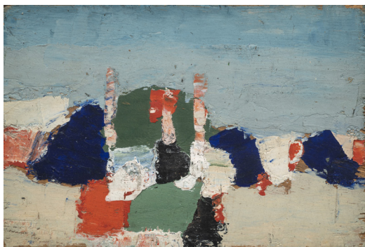
Le Lavandou, 1952 Huile sur carton, 11,8 x 17,8 cm

Au cours du printemps 1939, Jeanne Bucher fait la connaissance d'un jeune peintre russe âgé de 25 ans, Nicolas de Staël. Elle lui apporte alors son soutien pour se loger et lui achète ses premiers dessins en 1943. C'est en février 1944 que Jeanne Bucher expose l'artiste pour la première fois, aux côtés de Domela et Kandinsky. La première exposition personnelle de Nicolas de Staël à la galerie se déroulera un an plus tard, en avril 1945. Jeanne Bucher dira alors :