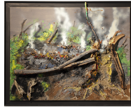
Après l'incendie, 2000. Technique mixte sur toile, 114 x 146 cm

Les œuvres de Paul Rebeyrolle, puissantes, violentes et généreuses sont montrées à la galerie à quatre reprises, à partir de 1999, dans la dernière période créatrice de l'artiste. Elles sont un appel à la liberté, une révolte contre l'injustice, l'intolérance, l'asservissement de l'homme et de la nature, un véritable témoignage de notre temps qui traque le réel de la manière la plus sensorielle et instinctive possible.