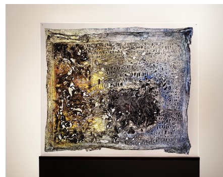
Matière-Lumière [Stèle], ML-V-19-0828, 2019 Technique mixte, 195 x 76 x 10 cm (dont colonne : 130 x 76 x 10 cm)

L'œuvre de l'artiste plasticienne allemande Evi Keller interroge le principe cosmique de la transformation de la matière par la lumière. Les empreintes de l'instant [sculptures, peintures, photographies, vidéos, sons et performances] révèlent un processus de substantialisation, qui s'incarne et se transfigure progressivement dans des installations que l'artiste désigne espaces de transition. Le cheminement à travers ces espaces a guidé l'artiste vers des créations Matière-Lumière témoignant de l'anthropocène. Constituées du carbone né dans les étoiles, noyau essentiel de toute matière vivante et recyclé par l'homme, ces œuvres sont animées et transmutes par absorption, transmission et réflexion en des matières changeantes dans l'interaction avec le spectateur. Par un processus alchimique, Evi Keller transfigure ainsi la mémoire de centaines de millions d'années en œuvres d'art.