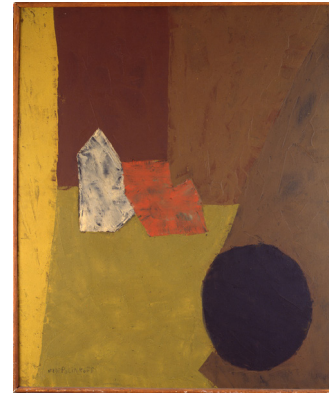
Serge Poliakoff, Composition , 1955 Huile sur toile, 100 x 81 cm

Menacé par la Révolution d'Octobre, Serge Poliakoff fuit la Russie en 1917, se réfugie en 1919 à Constantinople avec sa tante, la chanteuse Nastia Poliakoff qu'il accompagne à la guitare, puis s'installe à Paris en 1923 où il commence par jouer dans les cabarets russes.