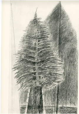
Histoire Naturelle - Le fascinant cyprès, 1926 Frottage reproduit en colotype, Planche XVII, 50 x 33 cm

Les 36 dessins pour l'édition Histoire Naturelle firent l'objet de la première des trois expositions consacrées par Jeanne Bucher à l'artiste allemand entre 1926 et 1929.