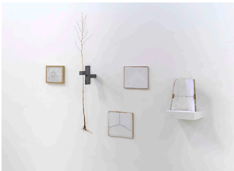
Paul Wallach, Yielding Place , 2021, bois, plomb, branche, plâtre, toile, papier, ficelle, peinture et crayon, 85 x 127 x 16,5.

EN DIRECT / EXPOSITION YIELDING PLACE DE PAUL WALLACH ( HTTP://POINTCONTEMPORAIN.COM/TAG/PAUL-WALLACH/ ) JUSQU'AU 02 NOVEMBRE 2021, GALERIE JEANNE BUCHER JAEGER