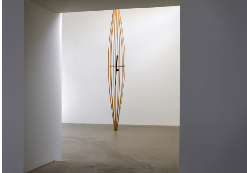
Paul Wallach, N'a de fin , 2021

Bois, acier, fil de fer et ficelle, 400 × 43 × 43 cm