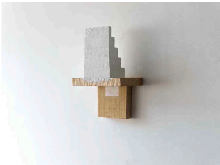
Paul Wallach, Some Other Where Else , 2020, Bois, peinture, papier

Laëtitia Bischof ( http://pointcontemporain.com/tag/laetitia-bischoff/ )