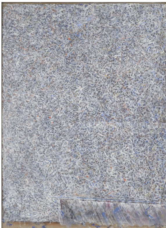
Escape from Static , 1968 tempera sur papier, marouflé sur panneau, 67 x 48,5 cm