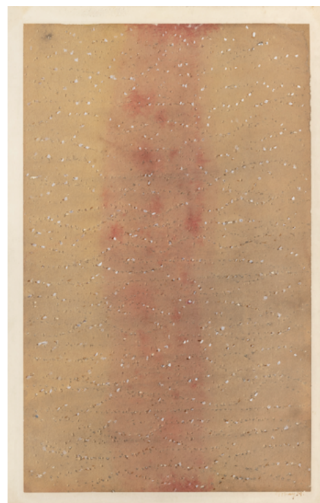
Pierced Space , 1959 tempera et incisions sur papier cartonné monté sur carton 46,50 x 30 cm

Sans cesse en mouvement – les anciens philosophes grecs tenaient cela pour l'essentiel de l'âme – Mark Tobey disait tenter de retirer du cosmos, quelques fragments de cette beauté que la vie renferme en