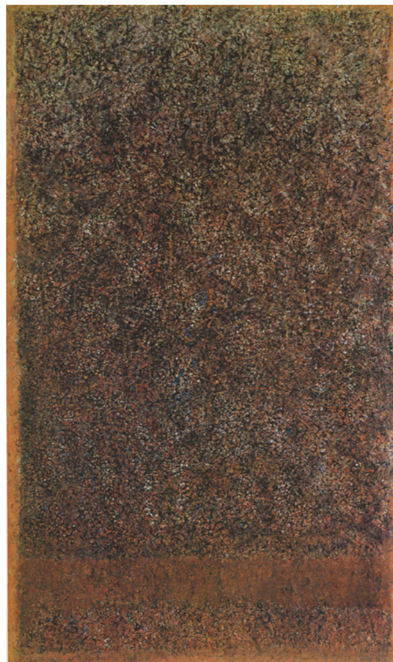
Unknown Journey , 1966 huile sur toile, 207 x 128 cm, © Adagp, Paris

En participant à ce projet novateur et non commercial avec la galerie historique de l'artiste en Europe et le Mnam / Cci Centre Pompidou, la Collection de Bueil & Ract-Madoux entend