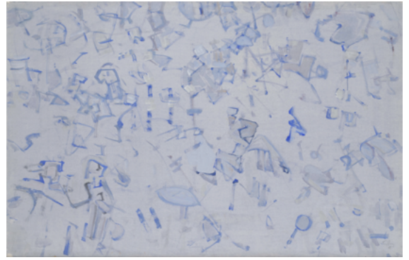
Rive Gauche, 1955 tempera sur papier. 61 x 91 cm

Zen, Tobey ne l'a jamais été, mais il avait déjà avant que d'en faire l'expérience, la même aversion pour tout raisonnement intellectuel et la même confiance pour toutes les impulsions issues de la nature. C'est en toute conscience qu'il assume la réalité, mais pour la connaître, comme disait maître Eckhart, il sait qu'il faut détruire l'apparence et plus on dépasse celle-ci plus on se rapproche de l'essence des choses. Abstraction, figuration sont pour lui des notions vides de sens. Aucun système, aucune règle