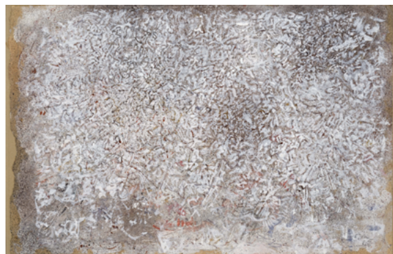
White Space , 1955 tempera sur papier, 20,5 x 31,5 cm Collection Particulière.

Finalement, cette façon de combiner le « champ » et l'« écriture » fait de Tobey un précurseur d'un certain art récent et contemporain : le minimalisme de Donald Judd avec ses plans limités/illimités, les écritures de Cy Twombly, les rencontres fécondes de Brice Marden avec l'art et la culture de l'Orient, la longue aventure de Robert Ryman avec le blanc, les filaments colorés minutieux de Zeng Fanzhi, et même la transformation habile du champ pictural en « cosmologie de signes » qu'opère Ellen Gal-