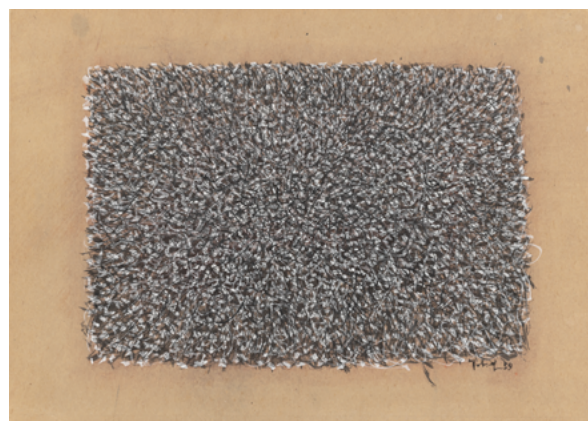
Within itself , 1959 tempera sur papier 20,3 x 28,8 cm