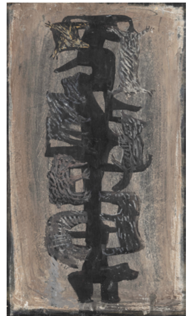
Animal Totem , 1944 tempera sur carton, 37 x 17,5 cm

Devant l'opposition du même et de l'autre, du particulier et du général, devant l'énigme de la limite, Tobey retrouve l'étonnement des penseurs de la Grèce archaïque. Le fait qu'A diffère de B fait pour lui si peu partie des vérités éternelles, qu'indéfiniment il reviendra sur ce fait stupéfiant. C'est par la fraîcheur retrouvée de cette interrogation que Tobey prend sa place