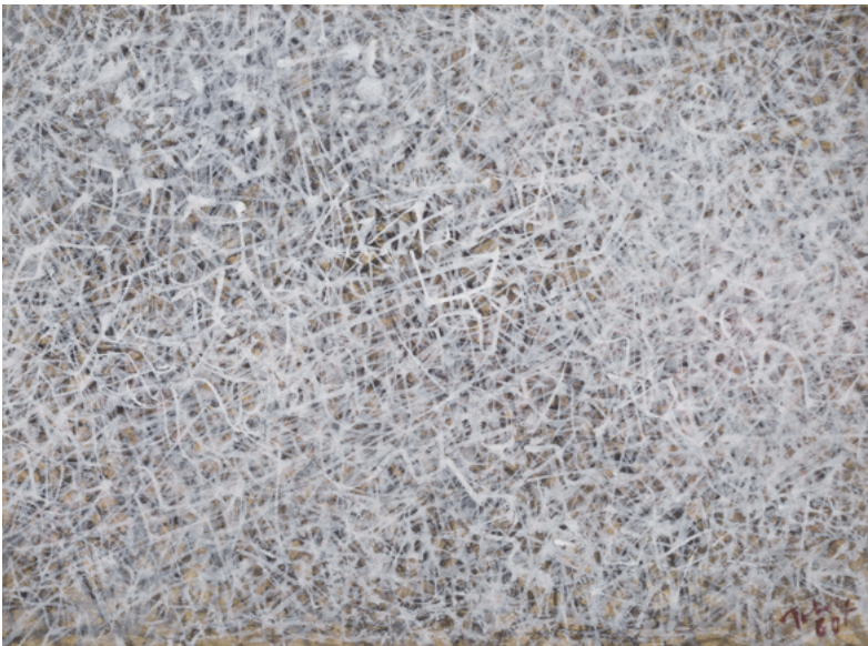
World , 1960 tempera sur papier, 12.5 x 17 cm

Sur les pavés des rues et sur les écorces des arbres, j'ai découvert des univers entiers. Je suis très peu au fait de ce que l'on appelle généralement «abstrait». L'abstraction pure serait pour moi une peinture dans laquelle on ne trouverait aucune affinité avec la vie, une chose pour moi impossible. J'ai cherché un monde «un» dans mes peintures mais pour le réaliser j'ai utilisé comme une masse tourbillonnante. Je n'assume aucune position définie. Peut-être que ceci explique la remarque faite par quelqu'un qui regardait une de mes peintures : Où est le centre ?