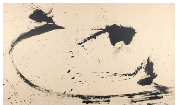
Composition N°1 , 1957 encre sumi sur papier marouflé sur toile 61 x 97,8 cm