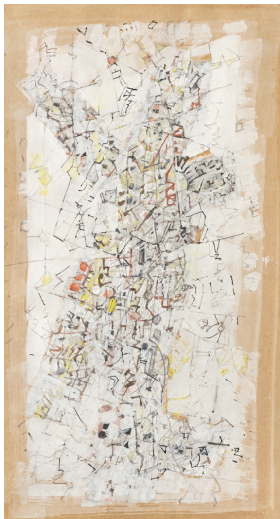
Jazz Singer, 1954 gouache, encre et crayon sur papier 45.1 x 29.5 cm