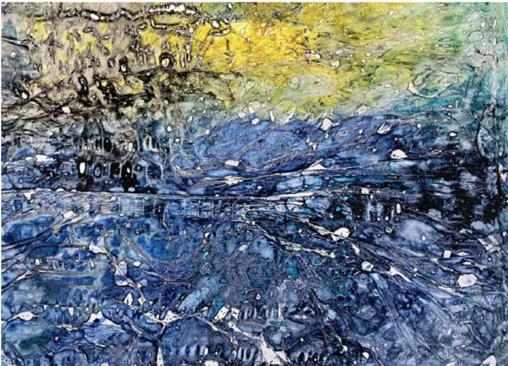
EVI KELLER, MATIÈRE-LUMIÈRE [STÈLE] , ML-V-20-1017, 2020, DÉTAIL © EVI KELLER