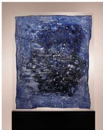
Evi Keller (née en 1968), Matière-Lumière (Stèles) ML-V-20-1008, 2020, 203 x 62 x 10 cm. COURTESY DE L'ARTISTE & JEANNE BUCHER JAEGER, PARIS

Après les voiles monumentaux présentés à la galerie en 2017, elle invite à un face-à-face plus intime et plus frontal avec ces stèles, souvenirs des pierres dressées auxquelles le monde antique donnait une valeur mémorielle ou spirituelle. Chacune renferme ce qui pourrait être une page de manuscrit, témoin d'une civilisation oubliée tout juste mise au jour par des archéologues de l'immatériel. Un sentiment de grande fragilité et de préciosité se dégage de ces vestiges d'un temps enfoui au plus profond de nos cellules, ici préservés et sacralisés, mais qui pourraient aussi bien être réduits en poussière : la vulnérabilité de