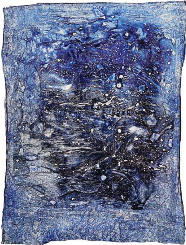
Matière-Lumière [Stèle], ML-V-20-1008, 2020 Technique mixte, 81 x 62 x 10 cm Socle : 110 x 62 x 10 cm Courtesy of the artist and Galerie Jeanne Bucher Jaeger, Paris