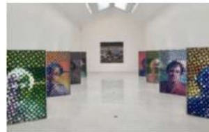
L'image selon Alain Jacquet

Vue de l'exposition « Stèles » d'Evi Keller, galerie Jeanne Bucher Jaeger, Paris, 2021.