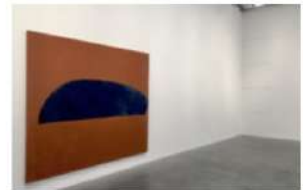
Les formes minimalistes de Suzan Frecon