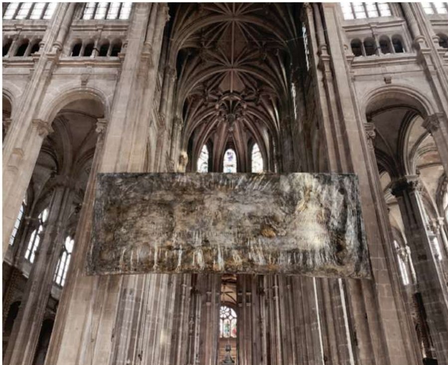
INSTALLATION PERFORMANCE/MATIÈRE/LUMIÈRE D'EVI KELLER, NUIT BLANCHE 2019, SAINT EUSTACHE, PARIS © EVI KELLER