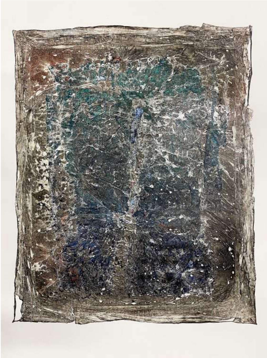
Matière-Lumière, 2020, Courtesy of Jeanne Bucher Jaeger, Paris

The gallery with its beautiful glass roof is suddenly inhabited by twenty stelae, transparent screens with a juxtapositions of painted films. They float like stalagmites and are both a refraction and a reflection of light. After working on cristal, glass, mirror, plexiglass, stone, wood and metal, Evi Keller now uses carbon based films which replace plastic and are completely organic. They allow her to play with the light and this is particularly striking when the large pieces of cloth hang outside in the forest or in a church like it did at Saint Eustache in 2019.