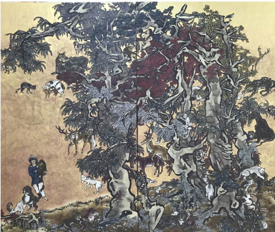
Mustard Seed Garden - Young Man with Leopard, 2014-2016, encre et couleurs minérales sur soie montée sur toile, 150 x 140 cm

Vernissage le samedi 30 novembre, 16h-19h, en présence de l'artiste