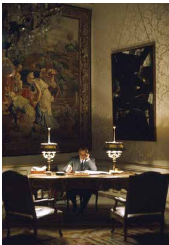
Georges Pompidou, Premier ministre, travaillant le soir à son bureau, à l'hôtel Matignon, durant les événements de mai 68 avec le tableau de Soulages accroché derrière lui