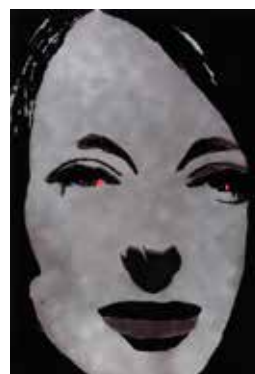
Martial RAYSSE (1936 – ) Tableau dans le style français II, 1966 Collection Centre Pompidou, Paris