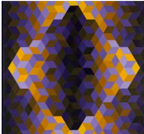
Victor VASARELY (1906 – 1997) Meh (2) (Abeille) , 1967-1968 Collection Centre Pompidou, Paris

Avec la nouvelle aisance financière que connaît dès 1953 Georges Pompidou, désormais banquier chez Rothschild, les achats deviennent plus conséquents : la collection prend alors une forme plus précise, plus audacieuse et, après les abstraits, les cinétiques (Vasarely, Cruz Diez) vont commencer à intéresser Claude et Georges Pompidou, sans doute par le truchement de Fontana et Herbin. C'est pourtant encore un grand maître de l'abstraction contemporaine que Georges Pompidou va faire entrer à Matignon lorsqu'il est nommé Premier Ministre en 1962. L'anecdote vaut d'être contée : Pompidou va avec Malraux au musée d'art moderne pour choisir une toile de Soulages de 1957, qui représente pour celui-ci «la dérélition de l'homme sans Dieu», et l'accroche derrière son bureau ; geste d'une audace à la fois esthétique et politique sans précédent, véritable manifeste que cette toile exposée aux yeux de tous ceux qui rendent visite au Premier Ministre et restent, pour beaucoup, bouche bée devant l'introduction fracassante de l'art contemporain dans le décor XVIII e des ors fatigués de la République...