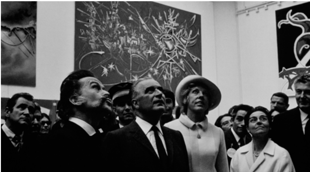
Ala manufacture des Gobelins avec Georges Mathieu qui montre au couple Pompidou des cartons de tapisserie (1969)

Certes, le Premier Ministre Georges Pompidou assume alors des responsabilités qui réduisent à la portion congrue ses loisirs, mais il continue de visiter expositions et galeries, quitte à se faire ouvrir ces dernières dès 8 heures du matin. De Staël, Braque et Ernst font également leur entrée à Matignon, Fautrier aussi sans doute, et la collection s'enrichit de nouveaux artistes, parmi lesquels les Nouveaux Réalistes comme Arman, Raysse, Klein, Niki de Saint Phalle et Tinguely qui vont devenir des amis du couple Pompidou, mais également Hartung, Tal Coat, Bettencourt et bientôt les tenants de ce qu'on appellera abusivement la Nouvelle Figuration (Adami, Monory, Voss, Arroyo, etc.). C'est cependant encore Fontana qui sera accroché dans les bureaux de La Tour Maubourg où s'installe Pompidou entre Matignon et l'Elysée, qu'il rejoint en 1969 lors de son élection à la tête du pays. C'est alors l'époque, plus médiatisée, du salon Paulin et du salon Agam : la France découvre, parfois avec stupéfaction, l'attrait du couple présidentiel pour une modernité audacieuse, qui enchante certains visiteurs officiels comme... la reine d'Angleterre !