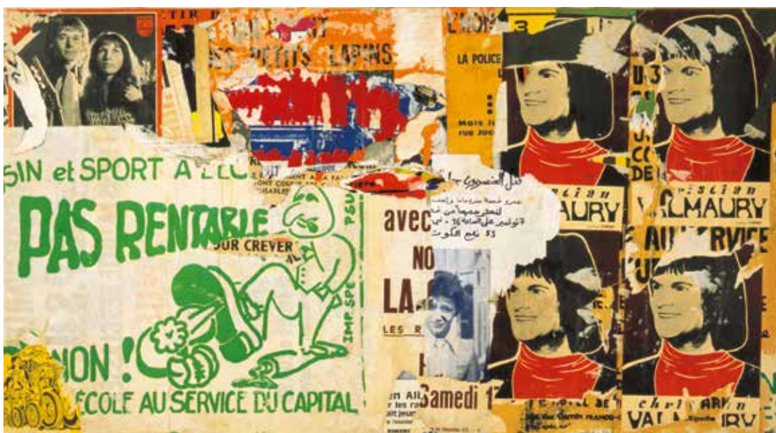
Jacques VILLEGLÉ (1926 - ) Rue de la Quintinie , 4 juillet 1972

Toutefois, il nous est apparu que cette diversité devait, dans l'espace d'exposition, être présentée de manière rationnelle, en suivant des principes esthétiques répondant à des regroupements homogènes, afin de souligner une coexistence, et non un désordre : Pompidou pouvait aimer à la fois des artistes de la nouvelle figuration et des abstraits d'avant-guerre, des cinétiques aussi bien que des nouveaux réalistes, en assumant une subjectivité consciente d'elle-même. L'exposition se développera sur 700 m 2 répartissant les oeuvres en 5 sections : Maîtres modernes (d'un pastel de Kupka de 1909 à des artistes de l'immédiat après-guerre) ; Abstractions ; Nouveau Réalisme ; Art cinétique ; Figurations. A ces espaces s'ajoutera un cabinet de dessins qui regroupera, en revanche, des artistes et des esthétiques très divers sur un même médium.