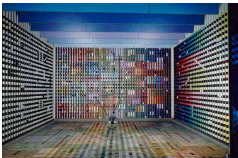
Yaacov AGAM (1928 – ) Aménagement de l'antichambre des appartements privés du Palais de l'Élysée pour le président Georges Pompidou (Salon Agam), 1972 – 1974 ; Collection Centre Pompidou, Paris

Yannick Mercoyrol, Directeur de la programmation culturelle du domaine national de Chambord Commissaire de l'exposition Georges Pompidou et l'art : une aventure du regard