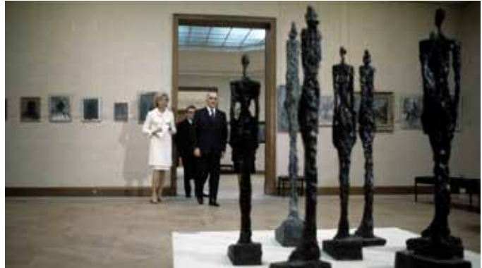
Georges et Claude Pompidou visitant une exposition d'art moderne au musée de l'Orangerie (1969)

Rien ne prédisposait Georges Pompidou à sa destinée exceptionnelle ou à la passion de l'art contemporain qui va le requérir. Ni sa naissance en 1911 à Montboudif dans un petit bourg du Cantal, ni son origine sociale : des parents d'origine modeste, hussards noirs de la République, dont un père jaurésien qui deviendra ensuite professeur d'espagnol.