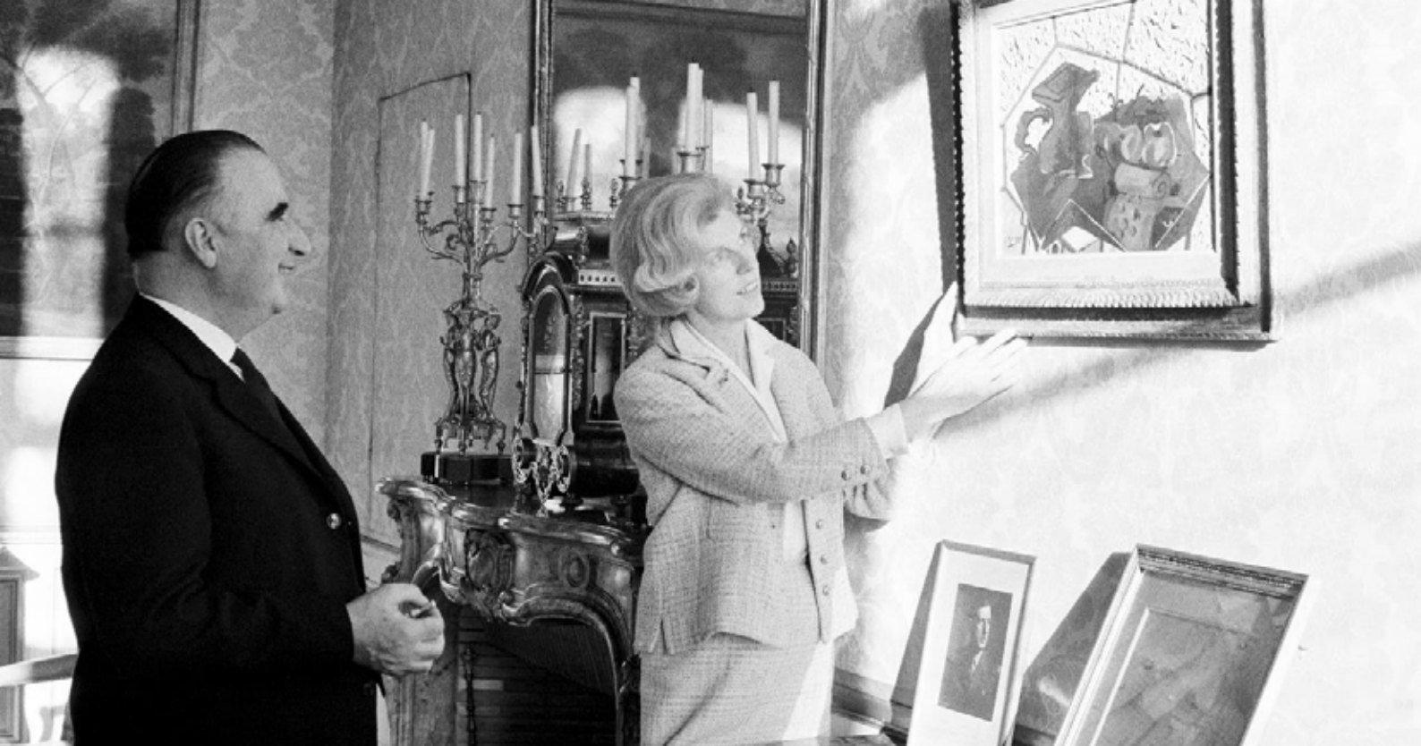
Le Premier ministre Georges Pompidou et son épouse Claude accrochent le Tapis vert de Braque dans le bureau de leurs appartements privés à l'hôtel Matignon (18 décembre 1962)