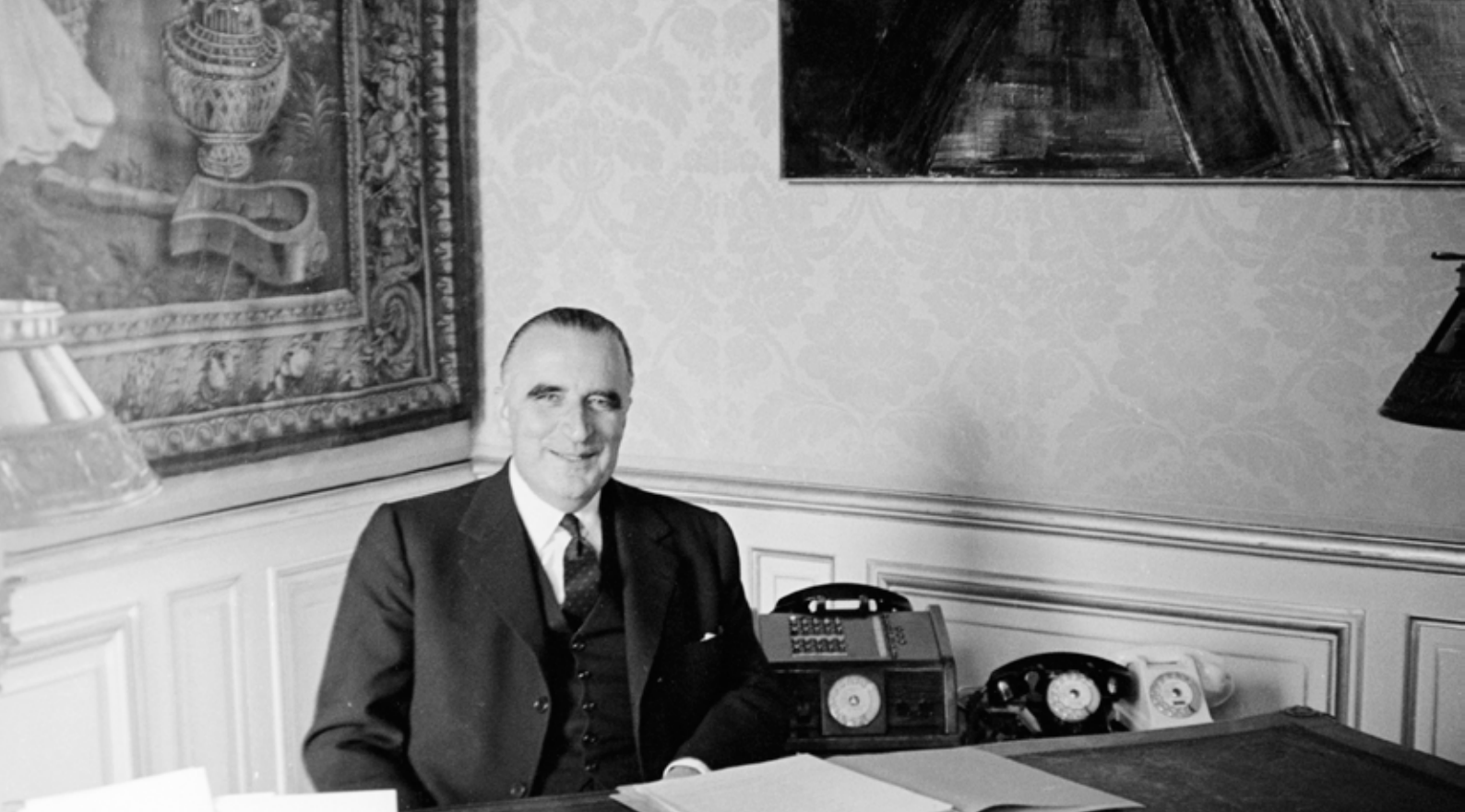
Le Premier ministre assis à son bureau à l'hôtel Matignon (décembre 1962)