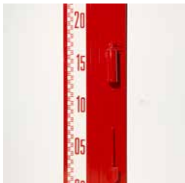
Jean-Pierre RAYNAUD (1939 – ) Mur PVC n°1350, 1969 Collection Centre Pompidou, Paris