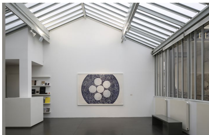
Vue de l'exposition La Nuit , Rui Moreira, 2014, Galerie Jeanne Bucher Jaeger, Marais, Paris