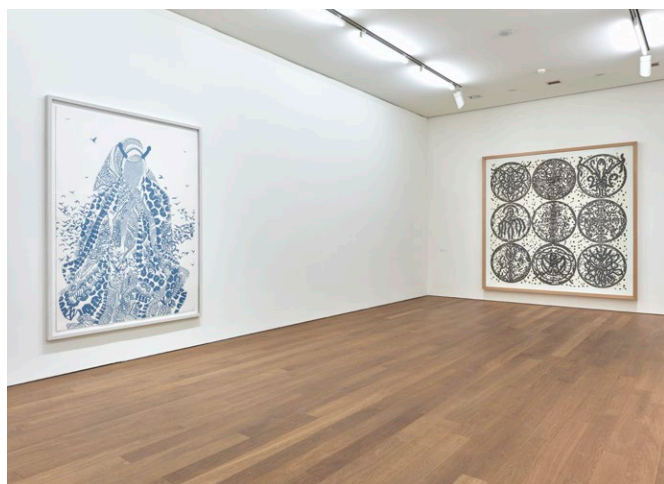
Vue de l'exposition I'm a Lost Giant in a Burnt Forest , Rui Moreira 2014, MUDAM, Luxembourg