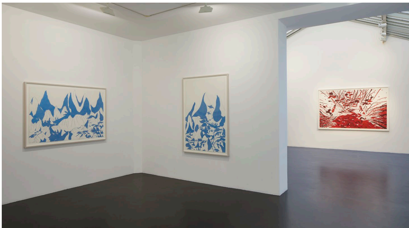
Vue de l'exposition The Passengers , Rui Moreira, 2022, Galerie Jeanne Bucher Jaeger, Marais, Paris

Depuis 2008, la galerie lui a dédié plusieurs expositions personnelles - Inner Monsoon en 2010, La Nuit en 2014, The Passengers en 2022 - et a accompagné nombre de ses expositions au sein d'institutions internationales : en 2014, le Mudam Luxembourg lui consacre une exposition d'envergure, en 2015, l'œuvre de Rui Moreira entre dans la Collection d'art contemporain de la Société Générale. En 2016, un ensemble de dix œuvres est présenté au Pavilhão Branco à Lisbonne . Intitulée Os Pirómanos , cette exposition est ensuite présentée au Centro Internacional das Artes José de Guimarães en 2017. En 2018, Yuko Hasegawa présente ses œuvres lors de l'exposition Saudade Unmemorable Place in Time – China-Portugal à la Foundation Fosun de Shanghai puis au Museu Coléção Berardo – Centro Cultural de Belém à Lisbonne. L'artiste est exposé au Musée d'art contemporain de Lisbonne, au sein de l'exposition III III IV V – five decades of ar.co en 2023.